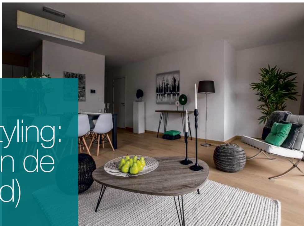
Vastgoedstyling_luxe-inrichting © Style at Home.

Een mooi ingerichte kamer, een verzorgd appartement, een gezellig aangekleed huis... you never get a second chance to make a first impression. Dat geldt zeker ook bij de verkoop van vastgoed. Geïnteresseerde kopers krijgen nu eenmaal een beter beeld van een pand als het er netjes uitziet. En daarvoor bestaan specialisten in home-styling.