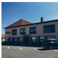
Projectgrond/ opbrengsteigendom Merelbeke

Interessante projectgrond aan het Floraplein in Merelbeke Flora met tal van publieke parkeermogelijkheden. Momenteel bevindt zich op het perceel een opbrengsteigendom bestaande uit een commercieel gelijkvloers, een 4-slaapkamerappartement en een studio met 2 slaapkamers.